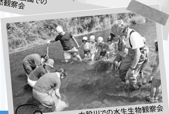
左股川での水生生物観察会

西区では、三角山や琴似発寒川をはじめとする豊かな自然のもと、環境に配慮したまちづくりを進めています。今月は、さまざまな取り組みや催しの一部をご紹介します。皆さんも、一緒に地球の未来のためにできることを考えてみませんか?