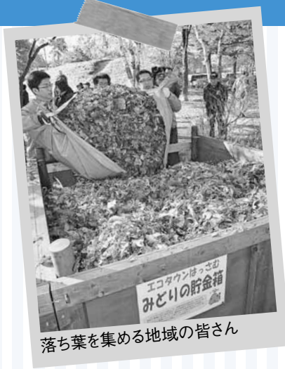
落ち葉を集める地域の皆さん