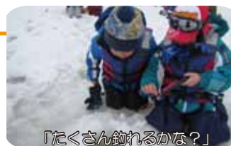
「たくさん釣れるかな?」

毎年恒例のわかさぎ釣り、もちろん今年も行ってきました。とにかく寒いわかさぎ釣りなのですが、今年は、風もおだやか、雪も降らず、気温は高めの良い日和に恵まれました。竿は短いのですが、仕掛けには7つの針、そして一つ一つの針への餌付け…。もちろん手袋をはいたままだと針がひっかかってしまうので、素手で…。「もうダメ、手が手が～」と苦しみながらも頑張り、準備が出来たら仕掛けを穴へ…。ピクピク!「わあ、いまゆれたよ!」「あ!きたよ!」と竿先のあたりに合わせて竿を引くと、クイツとわかさぎが…。「やった～、釣れた～!」とみんな大喜び!針から魚をはずすのに一苦労、思わず「もう、もうちょっと口あけてよ…」とわかさぎに話しかける姿も…。入れ食いの穴もたくさんあり、なんと今回は土曜日も日曜日も2百匹近く釣ることができました!お家に持って帰ったワカサギはおいしく食べたかな?また釣りに行こうね。