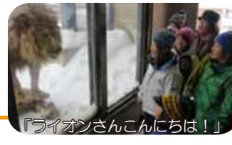
「ライオンさんこんにちは!」