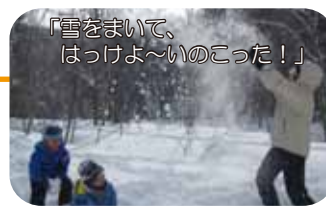
「雪をまいて、はっけよ～いのこった!」

砂川遊水地でのわかさぎ釣りに挑戦しました。スーパーのメンバーは何度か釣ったことのあるベテランぞろいにて、氷に穴を開けるところから、餌付け、魚をはずすところまで、すべて自分たちの手で頑張ってもらいました。当日は、すごくお天気がよく「こんなに温かいわかさぎ釣りはじめてだよ～、天国～♪」とノリノリでした。2日目は、旭山動物園へ。いつもの仲間で行くとなんだか楽しい動物園。ずっとチンパンジーに釘付けの班があったり…動いているカバがどうしても見たいと2回もカバを見に行く班があったり。満喫していました。6年生の多い今期のスーパー、修学旅行!?!の様な雰囲気8回目でした。