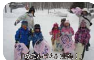
「森たんけんに出発!」