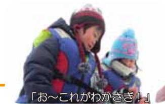
「お～これがわかさぎ!」

同じ札幌とは思えないくらい雪のある子どもの森ポラーノ、今回は更に奥の手稲山へ続く登山道へたんけんへ!まずは、ゆるやかコースに到着。最初はふかふかで滑りにくかったのですが、通称スーパーマンすべりを繰り返すうちに、ツルツルコースが出来上がり!その頃には、みんなの顔も真っ白に!そして、更に奥に進んで急斜面コースへ、「ここ行ける?けっこう急だよ?」との心配もよそに、「大丈夫。いくいく!」とやる気満々。ビューンと速い滑りや、ジャンプ、ズボットはまる滑り方など色々な滑りを楽しみました。そして最後は、ふかふか雪の上での相撲や水泳大会、雪のお風呂も楽しみました。年中さんと1年生の森あそびコース、みんな仲良しになれて、たのしい8回の活動となりました。また一緒にあそぼうね。