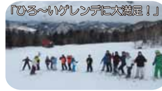
「ひろ～いグレンデに大満足!」

あそベンチャーのスキーキャンプは…たくさんすべって、もりもり食べて、たっぷり眠る2日間。1日目から、リフトを3回も乗り継いで頂上下まで上がり、林間コースをスイスイ滑り、ジャンプやウェーブコースにも挑戦しました。夜は、お楽しみドッチビー大会で盛り上がりました。そして、2日目のスキーにむけて早寝、早起き、素早い身支度!で頑張りました。もちろん、2日目もたっぷりすべることができましたよ。雪も最高!天気も最高!大満足の2日間になりました。